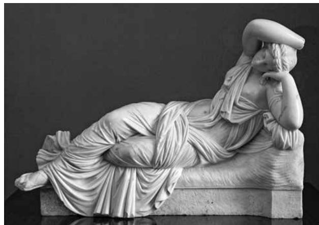
Т.-О. Сосновський. Спляча Аріадна. Походить з Новомалинського замку. Передана в РОКМ у 1941 р.

Робота працівників музею була далекою від справжньої наукової діяльності. Головною стала пропагандистська діяльність, що підтверджується документами архіву. Зокрема, на влаштування антирелігійної виставки було виділено 15 тис. крб. [Док. № 28]. Не жалкували грошей на замовлення