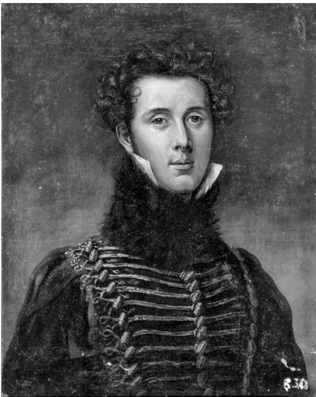
Портрет графа Альфреда Войцеха Потоцького. Походить з маєтку Потоцьких в Деражному. Передана в РОКМ у 1941 р.

Рівненського краєзнавчого музею не мають записів про своє походження і надходження до музею. Найчастіше зустрічаємо короткий запис «Зі старих фондів».