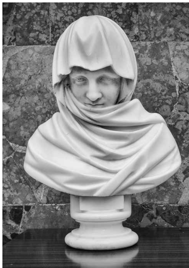
Т.-О. Сосновський. Невідома (Зима). Походить з Новомалинського замку. Передана в РОКМ у 1941 р.

картин і скульптур для виставки «Життя і діяльність товариша Сталіна» [Док. № 27].