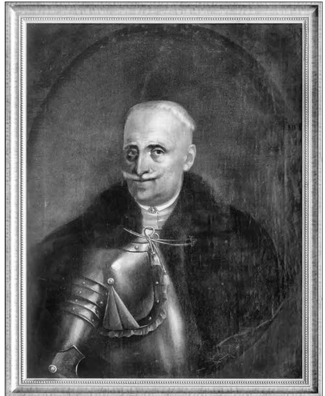
Портрет невідомого. Походить з колекції Дуніних-Карвіцьких в Мізочі. Передана в РОКМ у 1941 р.