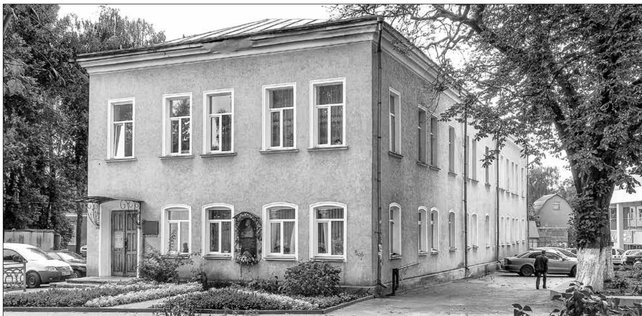
Будинок у якому у 1930-х рр. містився Господарчий музей Волині в Рівному (нині вул. 16 липня, 4 а). Фото, 2015 р.