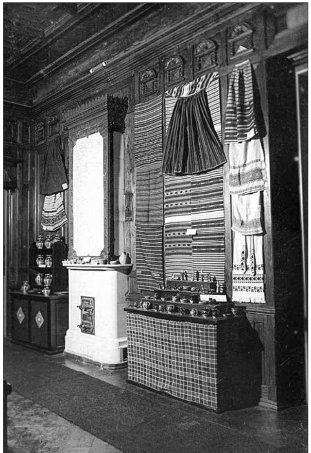
Експозиція Господарчого музею Волині в Рівному. Фото, 1930-ті рр.